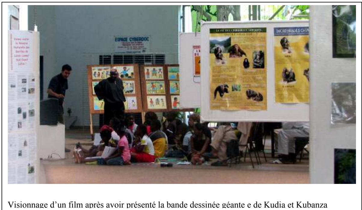
Visionnage d'un film après avoir présenté la bande dessinée géante e de Kudia et Kubanza

Après cette visite, un concours de narration était proposé aux classes : les 3 premières classes produisant la plus belle histoire relative à la conservation des grands singes seraient récompensées via la distribution d'un petit cadeau pour chaque élève.