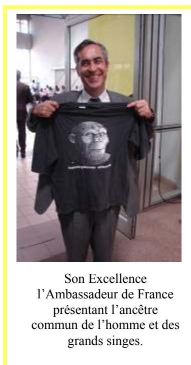
Son Excellence l'Ambassadeur de France présentant l'ancêtre commun de l'homme et des grands singes.

Suite aux discours de son Excellence l'Ambassadeur de France ayant adroitement retracé nos origines avec celles de nos cousins les grands singes, et du Directeur Général de l'Economie Forestière réaffirmant l'engagement de l'Etat congolais à lutter pour la conservation des grands singes, les présentations PowerPoint (entre 15 et 20 minutes) se sont succédées.